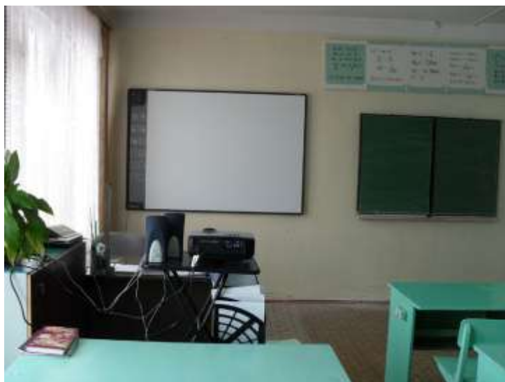
Кабинет русского языка с методикой преподавания