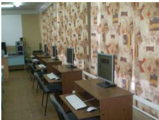
Компьютерный класс, оснащенный современными компьютерами с выходом в Интернет.